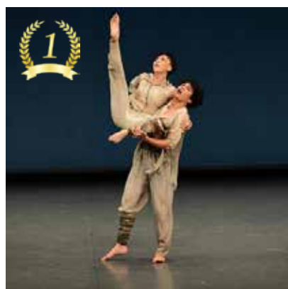
第1位 環太平洋大学ダンス部